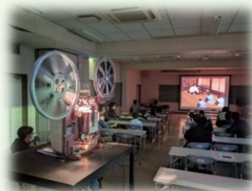
「こうやま・川の少年団」結団式でのアニメ教材視聴の様子

肝属東地区視聴覚教育協議会は, 肝付町と東串良町にある教育機関や各種団体を対象に, 視聴覚教材や機材の貸出しを行っています。コロナ禍の影響で利用が減少していましたが, ここ数年で大規模な集会が増加していることから, プロジェクターなどの映像機材の貸出件数も増えてきました。近年, 伝統行事は過疎化や高齢化により存続が危ぶまれているため, 文化財担当と共にアーカイブ化について検討を進めています。また, 役場各課で所有している教材を集約し, 一括管理できるよう担当者とともに検討を進めていく予定です。