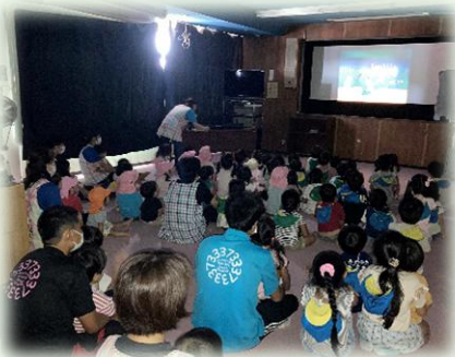
保育園で行われている → 16mm 映写機上映会の様子

垂水市視聴覚ライブラリーは, 市教育委員会社会教育課内にあり, 主に市内各団体への視聴覚教材の貸し出しを行っています。特に保育施設の16ミリフィルムの利用が多く, 映写機ならではの映像や音の臨場感が子供たちから好評です。また, 県視聴覚ライブラリーから定期的な教材借用や視聴覚教育だよりの発行を行っています。今後も視聴覚教材の活用を推進するために, 情報発信に努めたいと思います。