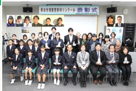
令和7年度県自作視聴覚教材コンクール表彰式