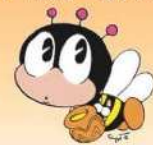
生涯学習のマスコット「マナビィ」

かごしま県民大学中央センター（県生涯学習課） 電 話 099-221-6604 メール kenmindaiigaku@pref.kagoshima.lg.jp